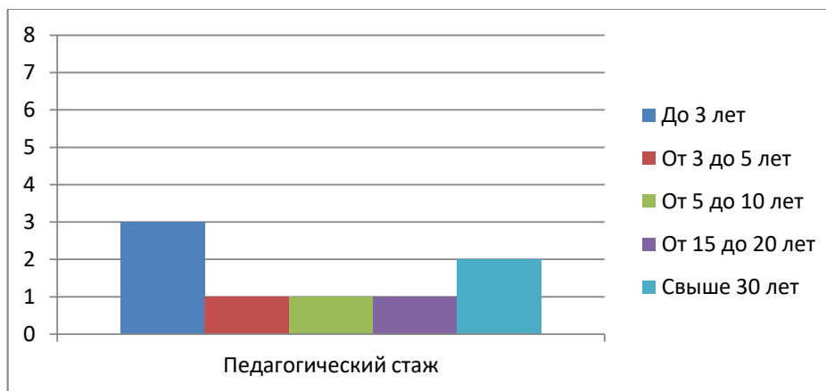
Диаграмма с характеристиками кадрового состава детского сада

По итогам 2021 года МБДОУ перешел на применение профессиональных стандартов. Из 8 педагогических работников МБДОУ все соответствуют квалификационным требованиям профстандарта «Педагог». Их должностные инструкции соответствуют трудовым функциям, установленным профстандартом «Педагог».