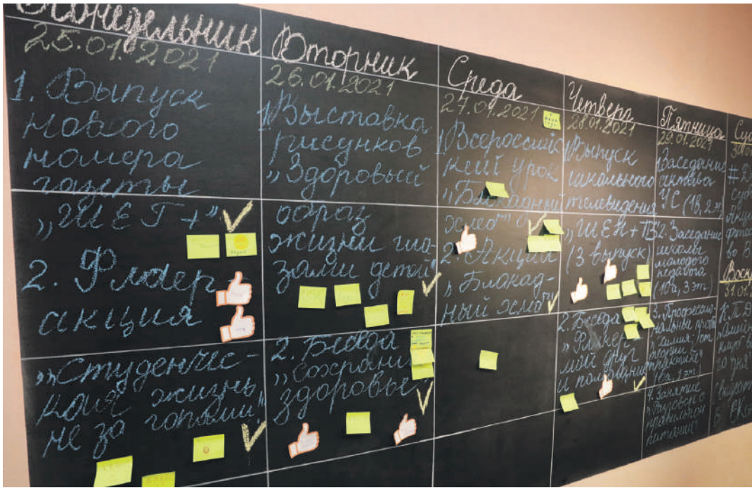
«Говорящая» стена в школе с УИОП