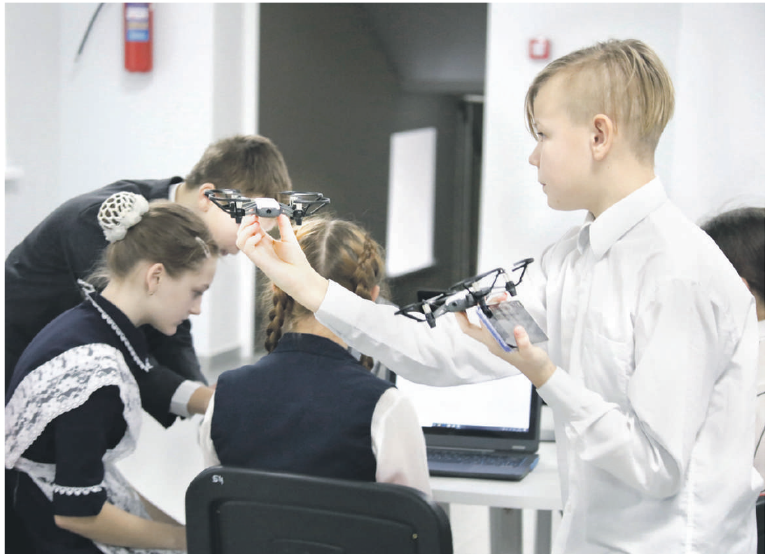
Квадрокоптерами сейчас даже в сельской школе никого не удивишь. С ними легко справляются в «Точке роста» Ровеньской школы № 2

На занятии внеурочной деятельности у младших школьников «Начинаем изучать английский язык» нам показали, как можно использовать флеш-карты (не компьютерные флешки, а карточки