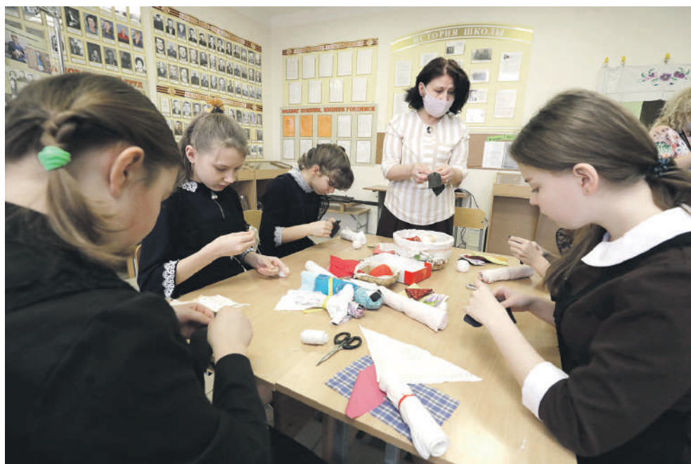
В рамках программы «Народная и авторская кукла» ученицы Новоалександровской школы учатся шить куклу-столбушку