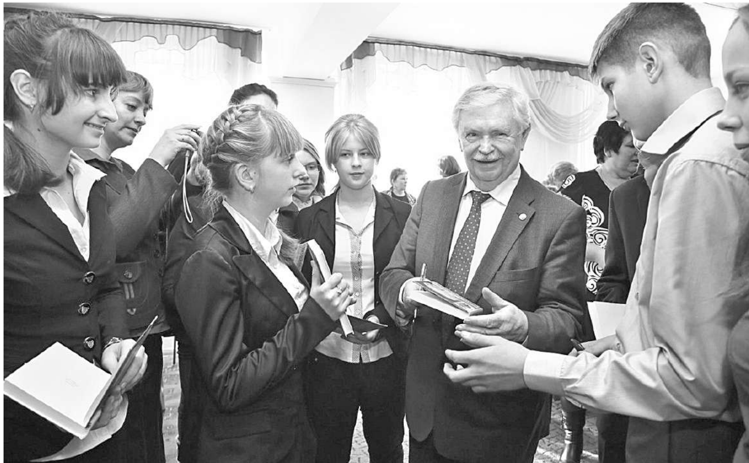
Альберт Лиханов в Грайворонской районной библиотеке

ПОЧЕМУ ЧИТАТЕЛЕЙ ПРОИЗВЕДЕНИЙ АЛЬБЕРТА ЛИХАНОВА МОЖНО НАЗВАТЬ НРАВСТВЕННЫМИ ЛЮДЬМИ