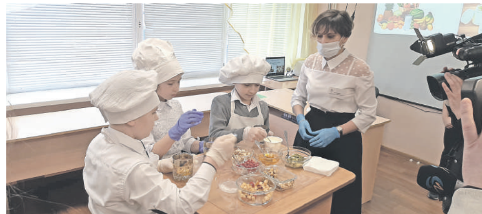
На внеурочке, посвящённой правильному питанию, ученики школы с УИОП готовят вкусные и полезные блюда