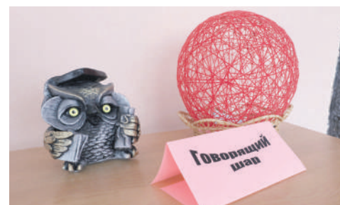
«Говорящий шар» в школе с УИОП. Ученики бросают в него свои отзывы и пожелания