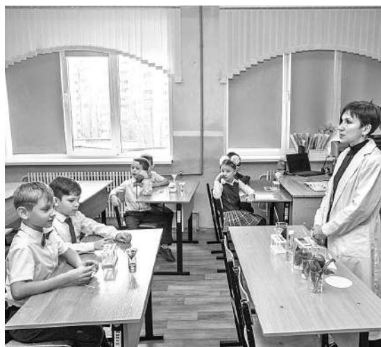
Шуховцы изучают кислотность почв