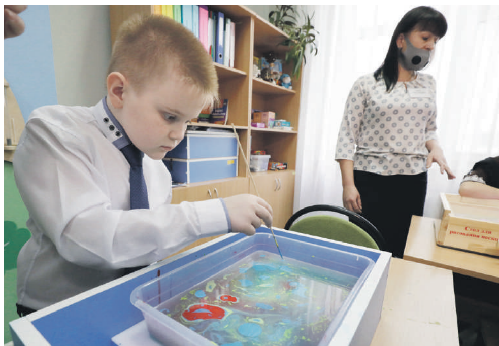
Занятие по акваанимации в Новоалександровской школе

Дальше директор ведёт нас в «деревню Йогуртово». Она расположилась в обычном классе, только вместо учебников и ручек на столе — йогурты, фрукты и другие начинки и добавки.