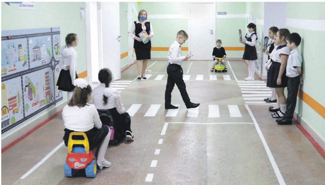
Занятия в образовательной зоне «Правила движения достойны уважения!» в школе № 2

ского творчества. Здесь занимаются и младшие школьники, для которых конструирование роботов — уже привычное дело. Как и для учеников школы с УИОП: в зависимости от возраста детей здесь действует два объединения дополнительного образования — «Робототехника» и «Введение в робототехнику».